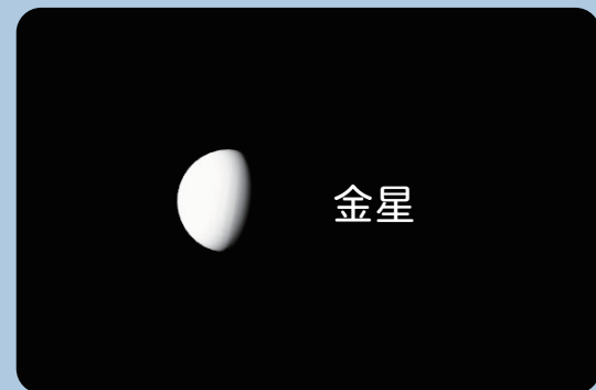
AstroArts ステラナビゲータ 12 にて作成