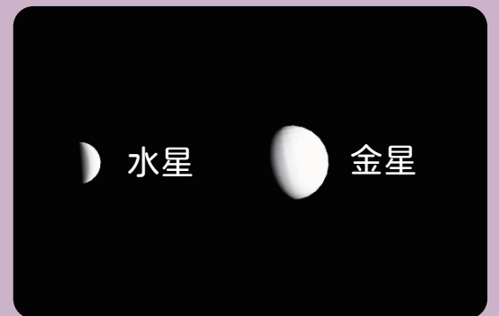
AstroArts ステラナビゲータ 12 にて作成