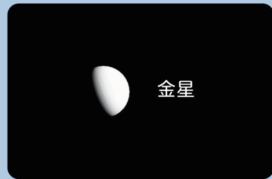
AstroArts ステラナビゲータ 12 にて作成